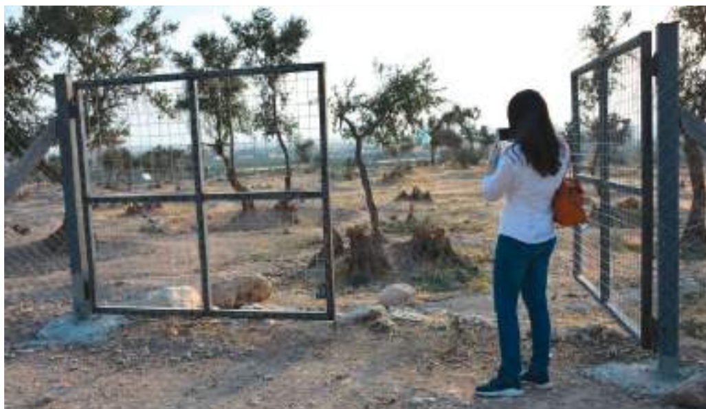
Début des travaux de l'oliveraie de Bahzani

Le nouveau planning permet d'envisager un achèvement du programme début 2021. Nous ne manquerons pas de vous tenir au courant de l'avancée du projet !