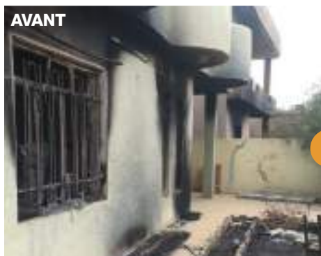
Rénovation d'une maison de Karamless