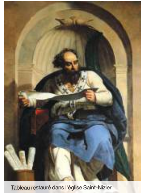
Tableau restauré dans l'église Saint-Nizier