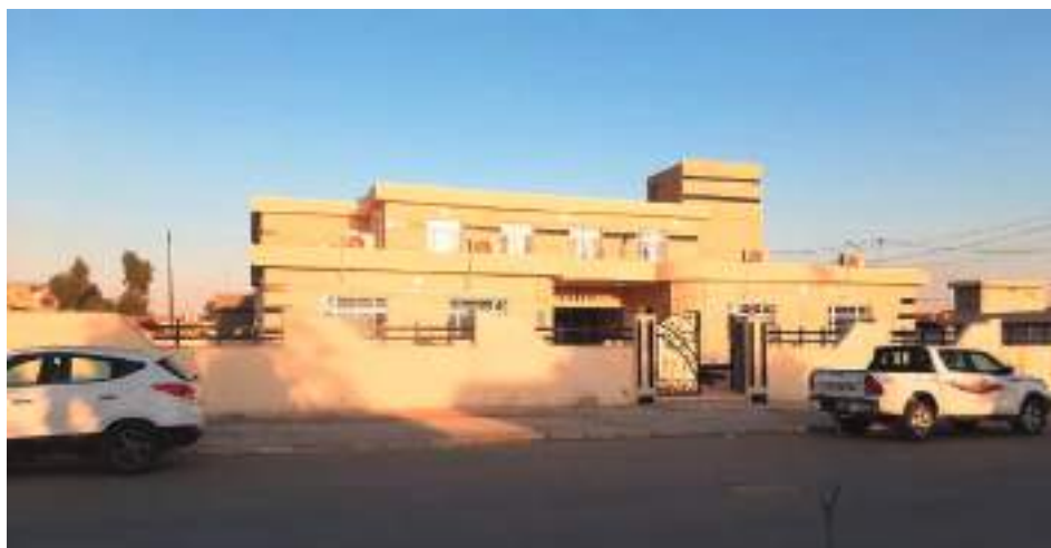
La nouvelle école de Qaraqosh

Les populations nouvellement installées dans la plaine de Mossoul se sont impliquées dans la réalisation des travaux de reconstruction de l'école. Le revenu issu de leur participation leur permet d'accélérer les réparations de leur maison, de nourrir leur famille ou d'investir dans des activités. La construction est réalisée par des entreprises