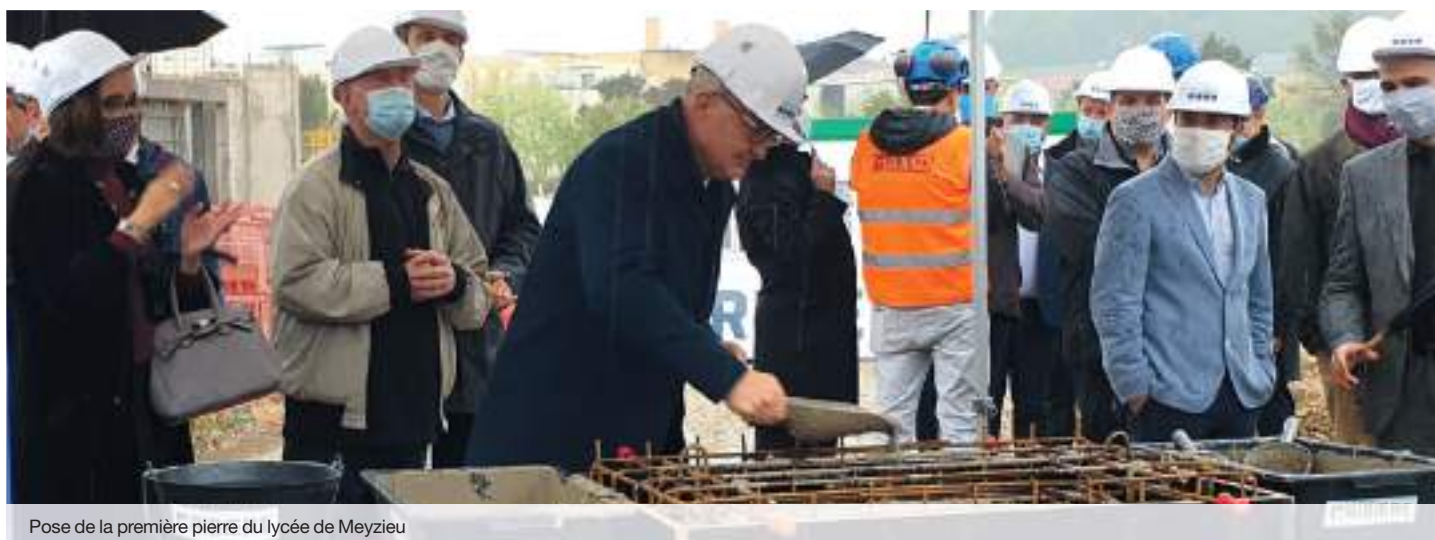
Pose de la première pierre du lycée de Meyzieu