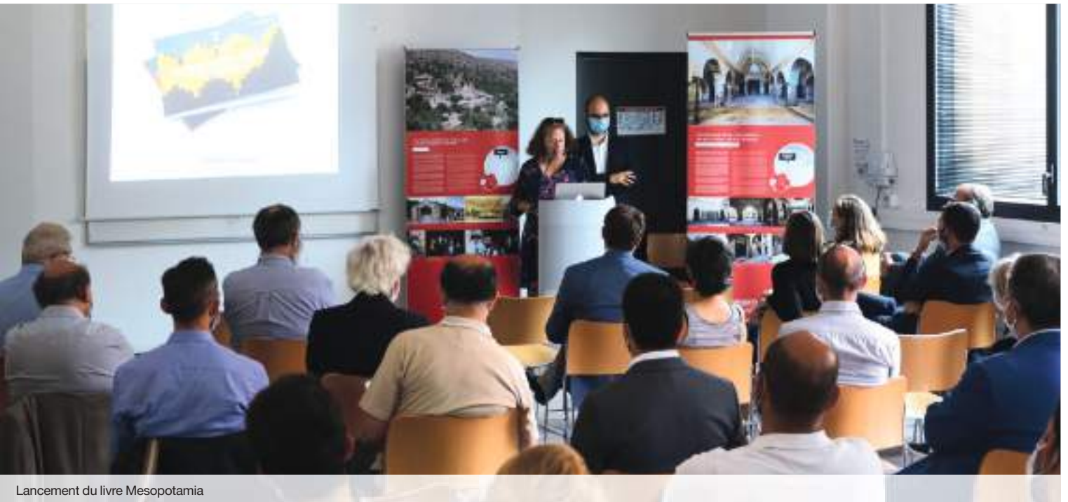
Lancement du livre Mesopotamia